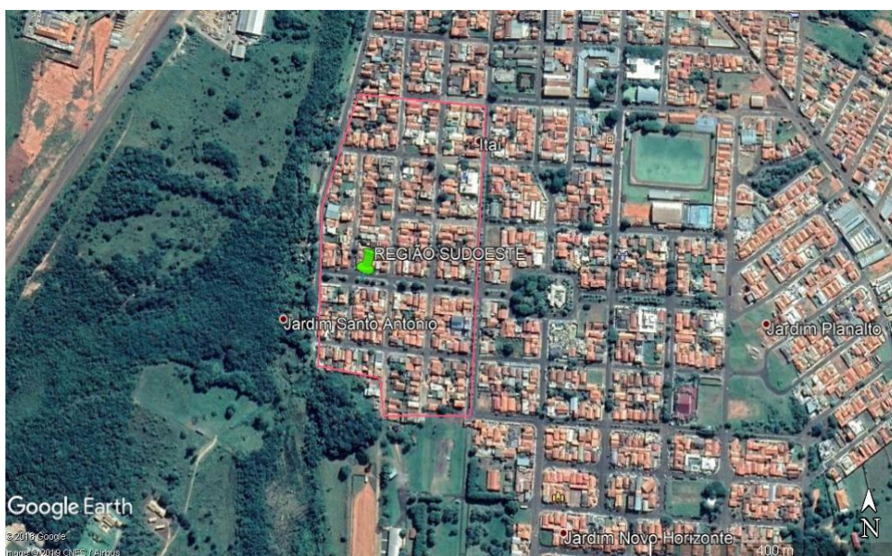
FIGURA 4 – Croqui da região sudoeste

Nessa região foram selecionadas 751 árvores.