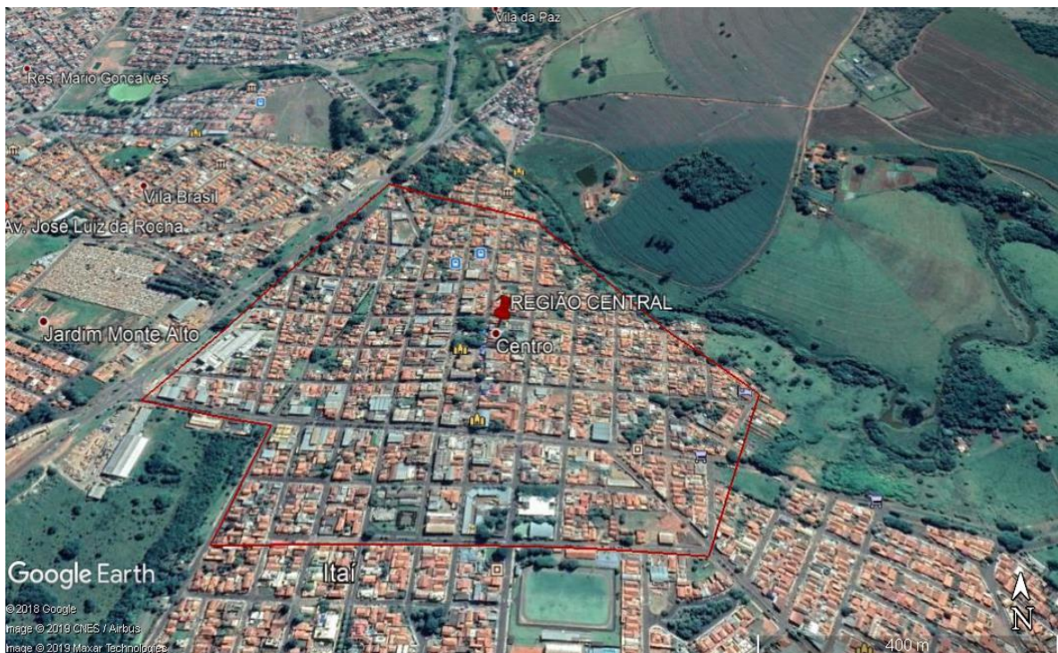
FIGURA 1 - Croqui da região central

Nessa região foram selecionadas 269 árvores.