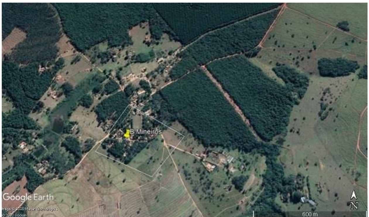
FIGURA 8 – Croqui zona rural Bairro dos Mineiros

Nessa região foram selecionadas 50 árvores