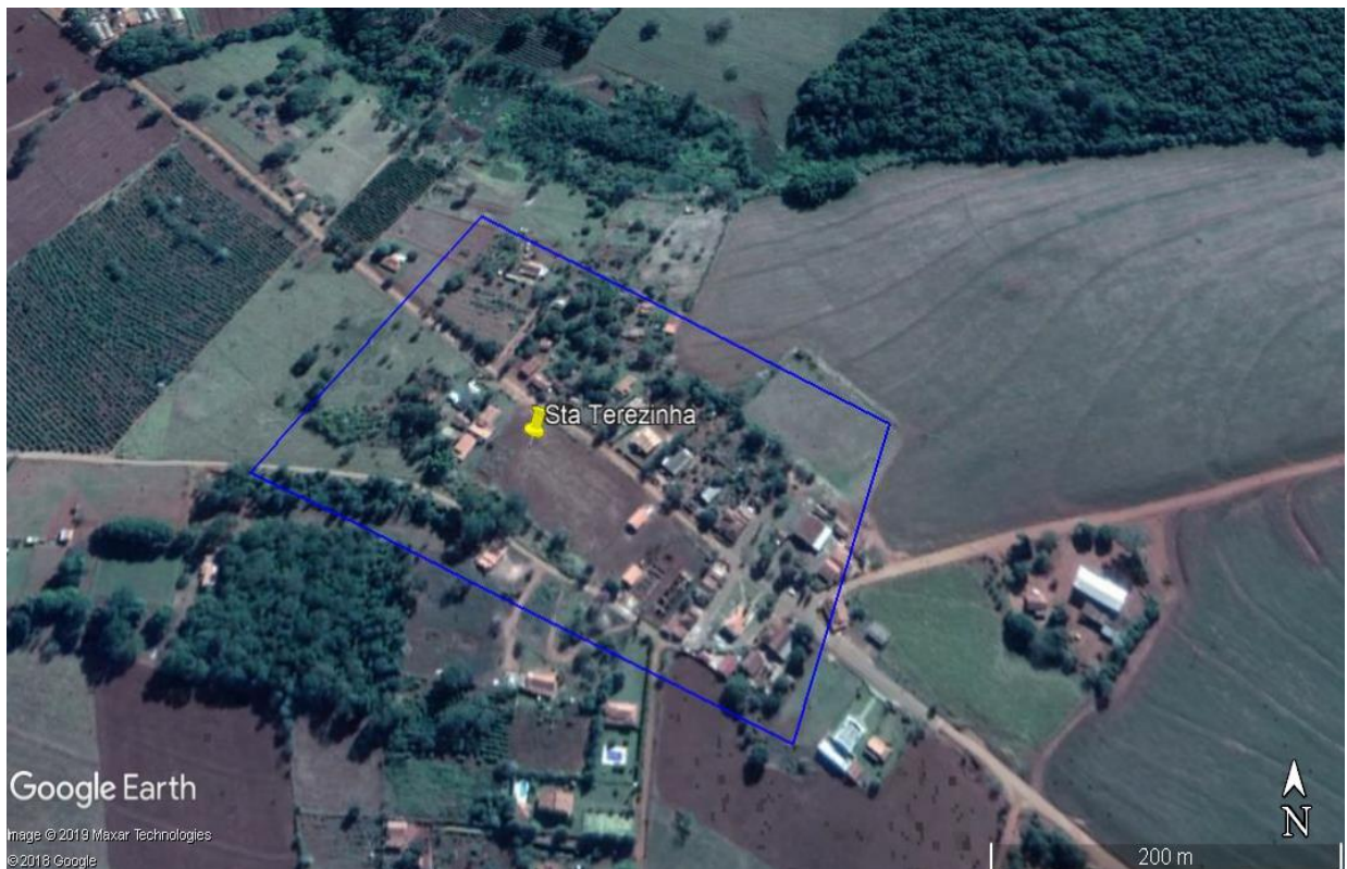
FIGURA 7 – Croqui zona rural Santa Terezinha

Nessa região foram selecionadas 926 árvores.