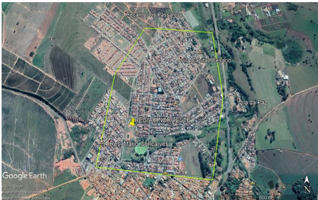
FIGURA 6 – Croqui da região noroeste

Nessa região foram selecionadas 130 árvores.