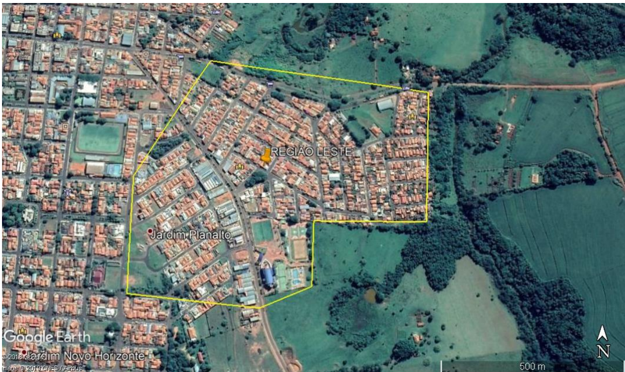
FIGURA 2 – Croqui da região leste

Nessa região foram selecionadas 269 árvores.