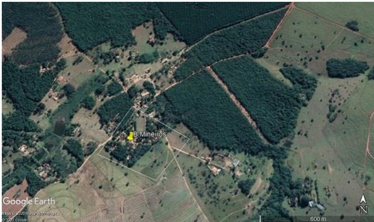
FIGURA 8 – Croqui zona rural Bairro dos Mineiros

Nessa região foram selecionadas 50 árvores