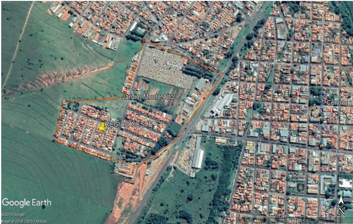
FIGURA 5 – Croqui da região oeste

Nessa região foram selecionadas 168 árvores .