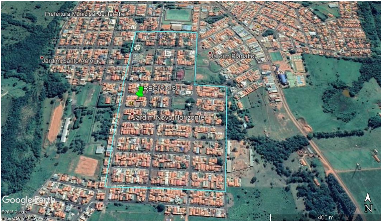
FIGURA 3 – Croqui da região sul

Nessa região foram selecionadas 751 árvores .