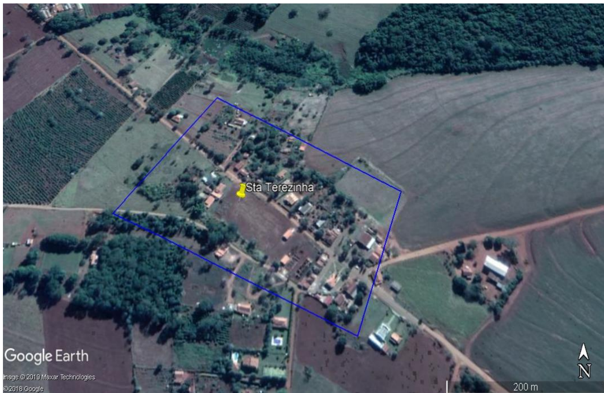
FIGURA 7 – Croqui zona rural Santa Terezinha

Nessa região foram selecionadas 926 árvores .