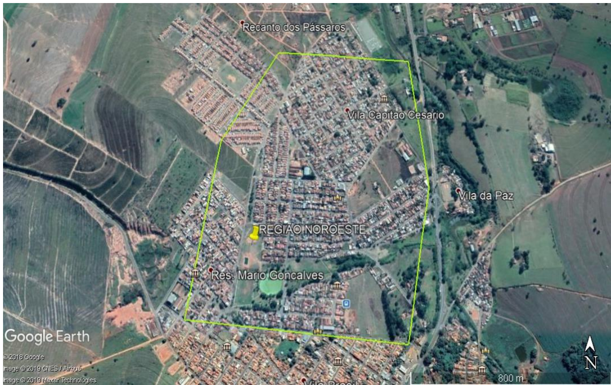
FIGURA 6 – Croqui da região noroeste

Nessa região foram selecionadas 926 árvores .