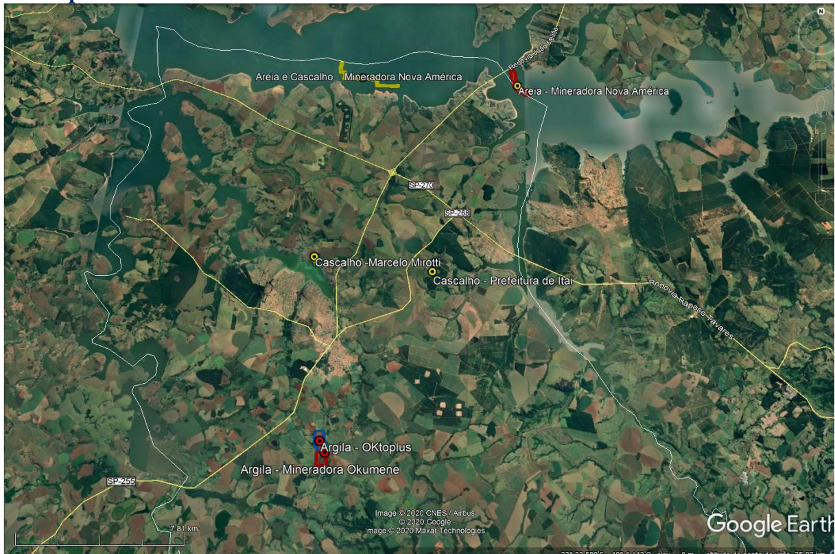
Imagem 4: Localização dos empreendimentos regularizados/renovação da LO no município de Itaipava